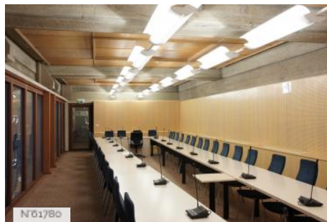
Conseil économique social et environnemental - Salle de Réunion 245