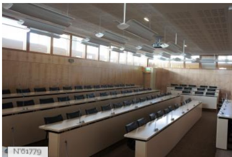
Conseil économique social et environnemental - Salle de Réunion 301