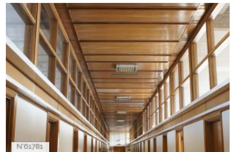
Conseil économique social et environnemental - Couloir des Groupes