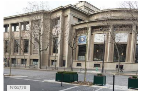
Conseil économique social et environnemental - Extérieurs