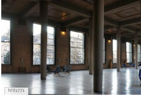
Conseil économique social et environnemental - Salle Hypostyle