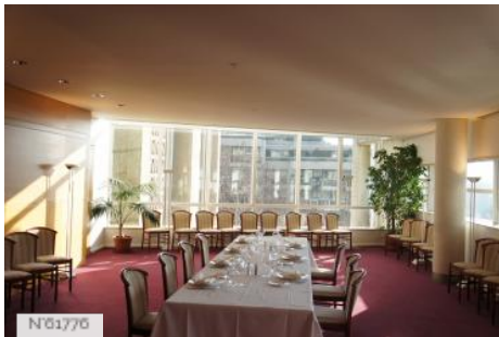
Conseil économique social et environnemental - Salon Eiffel