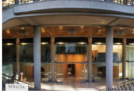
Conseil économique social et environnemental - Escalier Monumental