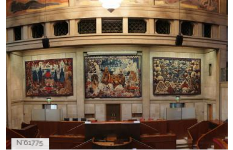
Conseil économique social et environnemental - Hémicycle ou salle des séances