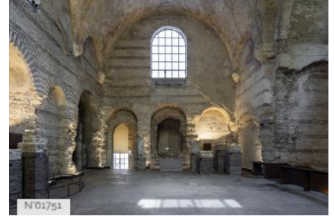
Musée de Cluny - Musée national du Moyen Âge - Collections du musée