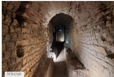
Musée de Cluny - Musée national du Moyen Âge - Souterrains du Musée