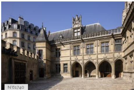
Musée de Cluny - Musée national du Moyen Âge - Cour