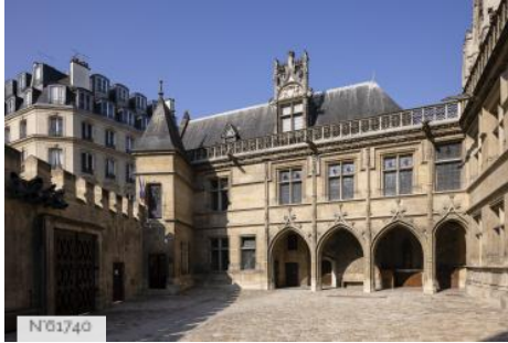
Musée de Cluny - Musée national du Moyen Âge - Cour