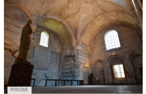
Musée de Cluny - Musée national du Moyen Âge - Frigidarium