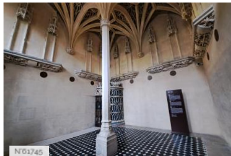
Musée de Cluny - Musée national du Moyen Âge - Chapelle privée des Abbés