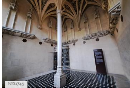
Musée de Cluny - Musée national du Moyen Âge - Chapelle privée des Abbés