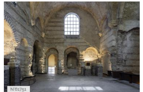
Musée de Cluny - Musée national du Moyen Âge - Collections du musée