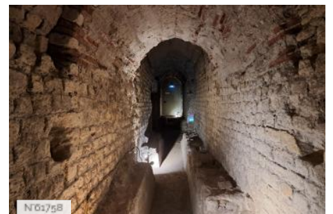
Musée de Cluny - Musée national du Moyen Âge - Souterrains du Musée