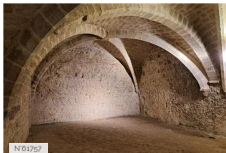
Musée de Cluny - Musée national du Moyen Âge - Cave gothique