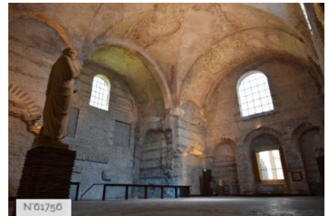
Musée de Cluny - Musée national du Moyen Âge - Frigidarium