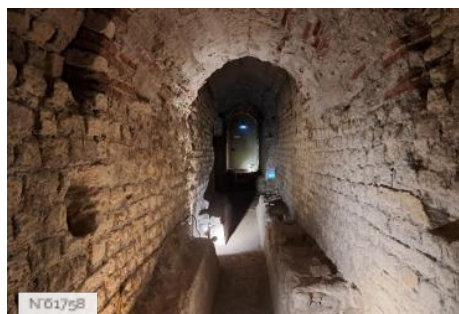
Musée de Cluny - Musée national du Moyen Âge - Souterrains du Musée