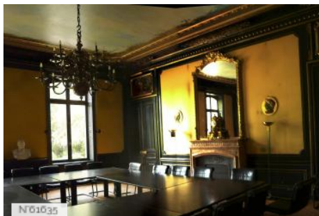
Préfecture des Yvelines - La salle à manger de Thiers