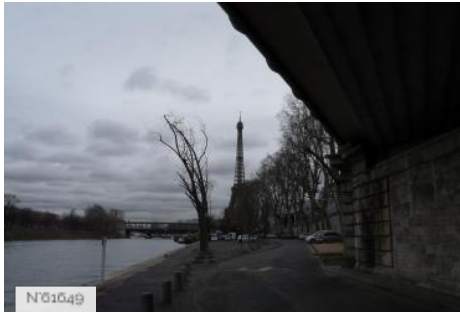
Ports de Paris - Port de Grenelle