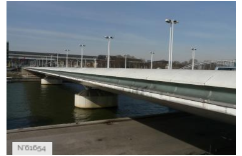
Ports de Paris - Port de la Rapée