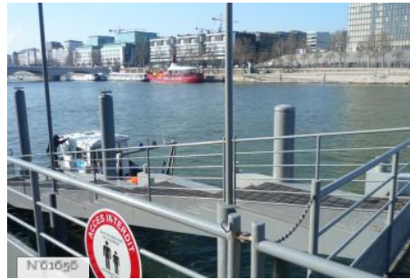
Ports de Paris - Port de Bercy Amont & Aval