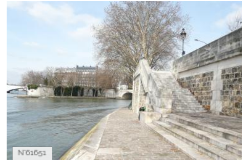
Ports de Paris - Port Henri IV