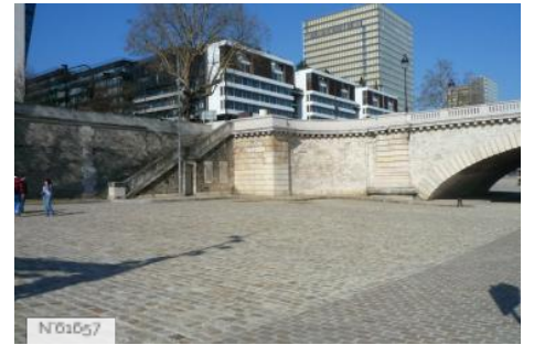
Ports de Paris - Port de Tolbiac