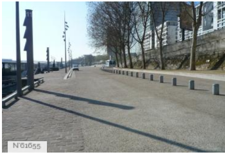
Ports de Paris - Port de la Gare