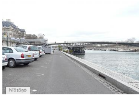
Ports de Paris - Port de Solférino