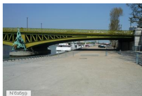
Ports de Paris - Port de Javel-Bas