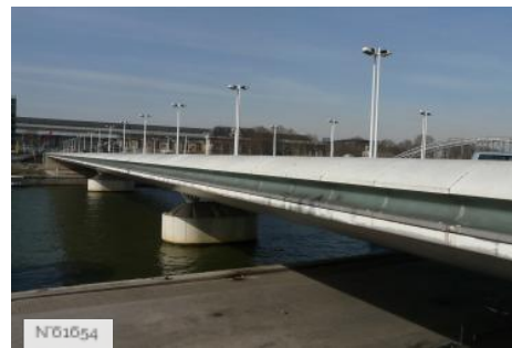
Ports de Paris - Port de la Rapée