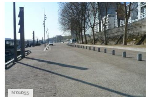
Ports de Paris - Port de la Gare