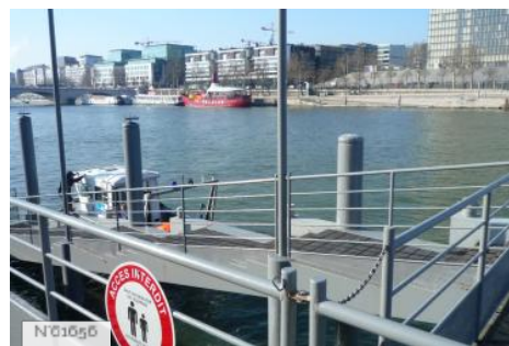
Ports de Paris - Port de Bercy Amont & Aval