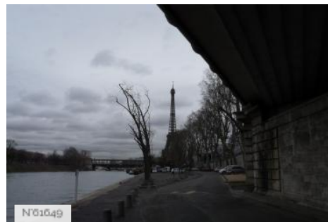
Ports de Paris - Port de Grenelle