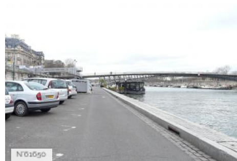
Ports de Paris - Port de Solférino