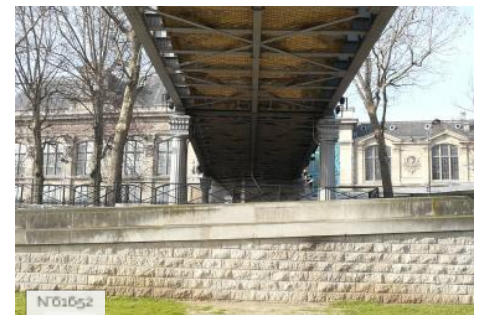
Ports de Paris - Port d'Austerlitz