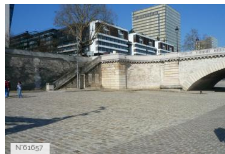
Ports de Paris - Port de Tolbiac