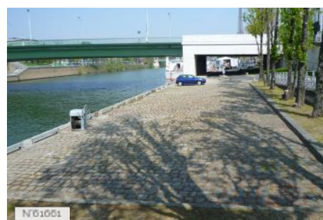
Ports de Paris - Port de Javel-Haut