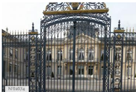
Préfecture des Yvelines - Cour d'honneur et jardin