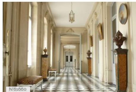
Préfecture des Yvelines - Galerie de la Cour d'honneur