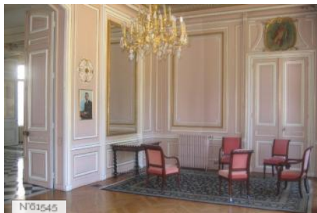
Préfecture des Yvelines - Salon Claude Erignac