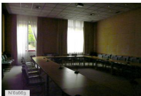
Préfecture des Yvelines - Salle Paul Demange