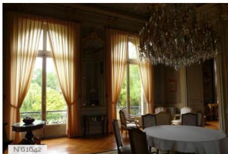
Préfecture des Yvelines - Salon de l'Impératrice Eugénie