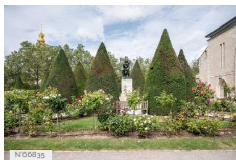
Musée Rodin - La roseraie de l'hôtel Biron