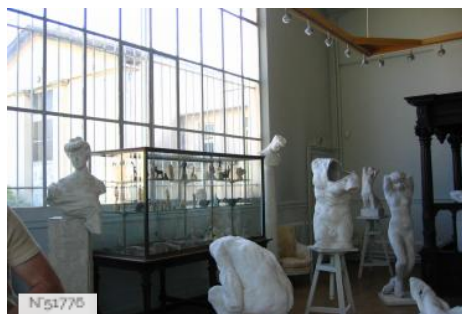
Musée Rodin de Meudon - Atelier de la villa des Brillants