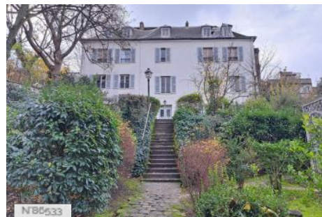
Musée de Montmartre - Jardin Bel Air