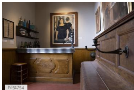
Musée de Montmartre - Salle du Bistrot