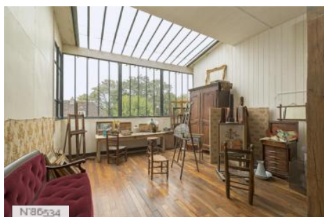
Musée de Montmartre - Appartement-Atelier Valadon