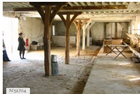
Musée de Port-Royal des Champs - Etable Ouest