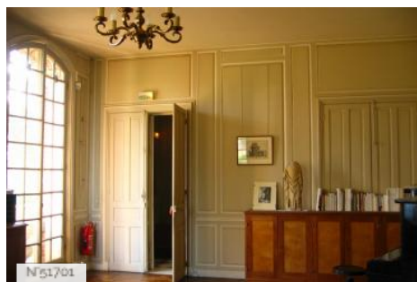
Musée de Port-Royal des Champs - Bureau