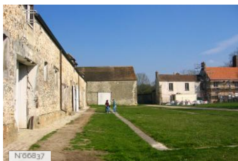
Musée de Port-Royal des Champs - Cour de ferme