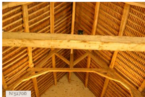
Musée de Port-Royal des Champs - Grange à blé