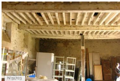
Musée de Port-Royal des Champs - Etable Nord