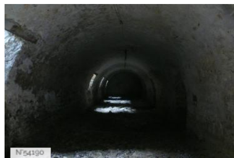
Musée de Port-Royal des Champs - Souterrains