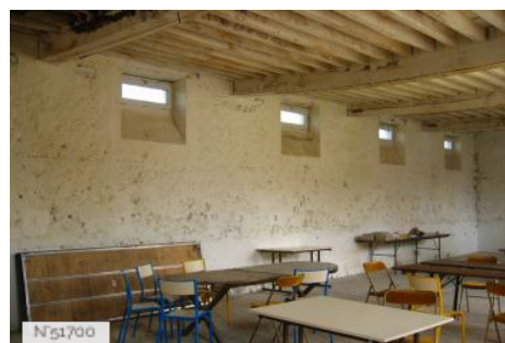
Musée de Port-Royal des Champs - Aile nord