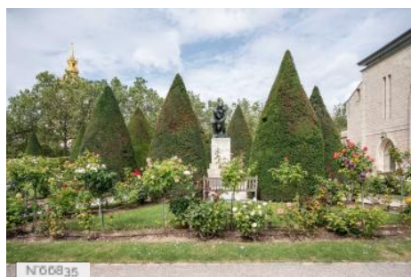
Musée Rodin - La roseraie de l'hôtel Biron