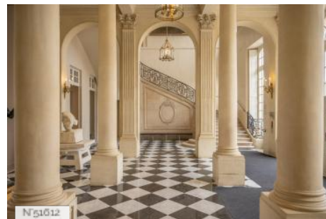
Musée Rodin - Hall de l'hôtel Biron