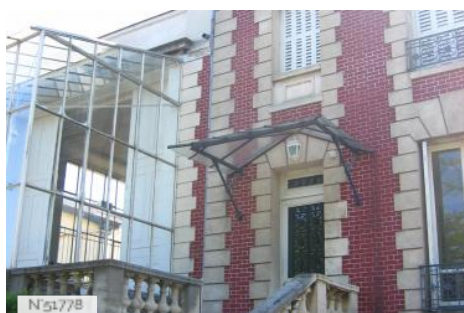
Musée Rodin de Meudon - Maison et parc