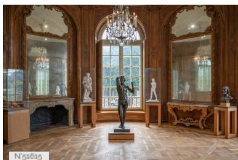
Musée Rodin - Salles d'exposition