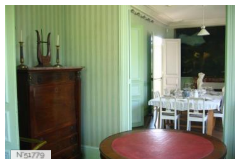
Musée Rodin de Meudon - Salon et salle à manger de la villa des Feuillants