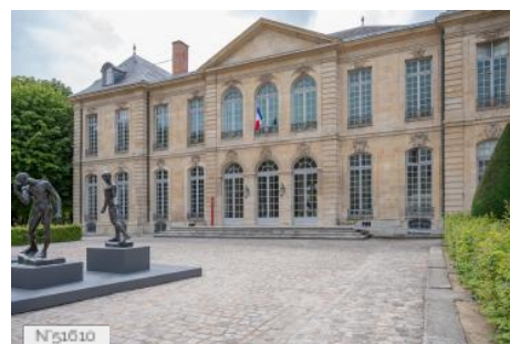
Musée Rodin - Cour d'honneur de l'hôtel Biron