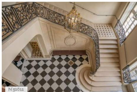
Musée Rodin - Escalier de l'hôtel Biron