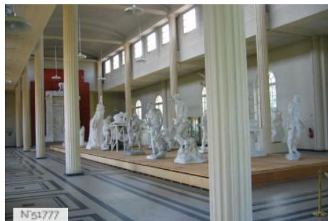
Musée Rodin de Meudon - Galerie des plâtres