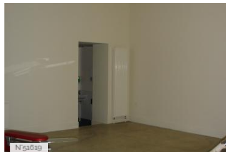
Parc culturel de Rentilly - Espace des Arts vivants