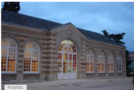
Parc culturel de Rentilly - orangerie