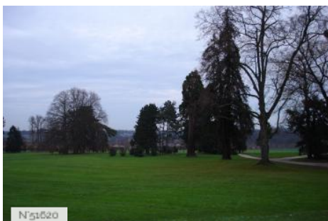
Parc culturel de Rentilly - Extérieurs