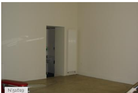
Parc culturel de Rentilly - Espace des Arts vivants