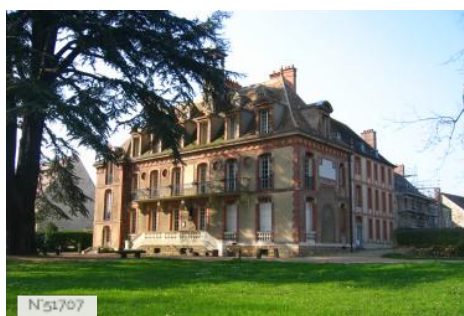
Musée de Port-Royal des Champs - Maison extérieur (aile 19ème)