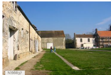
Musée de Port-Royal des Champs - Cour de ferme