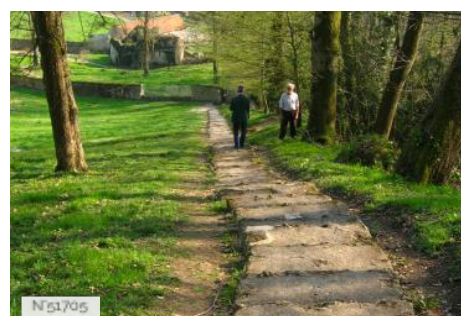
Musée de Port-Royal des Champs - Extérieurs