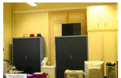
Lycée Octave Feuillet - bureau gestionnaire