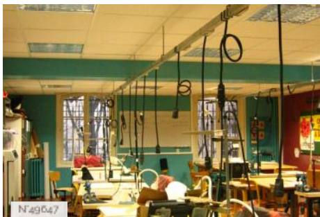
Lycée Octave Feuillet - Atelier de chapellerie