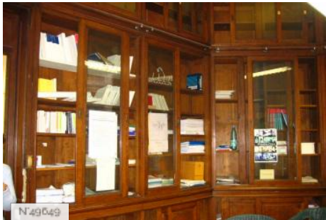
Lycée Octave Feuillet - bureau