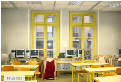
Lycée Octave Feuillet - Salle informatique