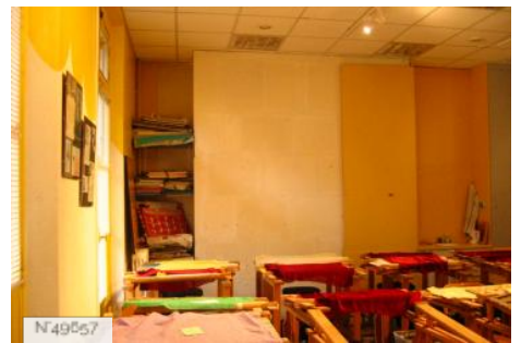
Lycée Octave Feuillet - Salle de broderie