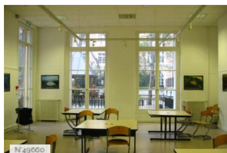
Lycée Octave Feuillet - Salle défilé