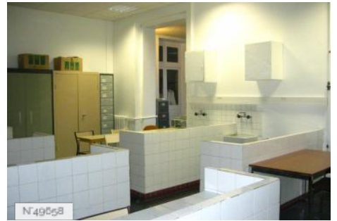
Lycée Octave Feuillet - Salle de laboratoire