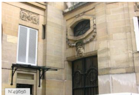
Lycée Octave Feuillet - Petite cour