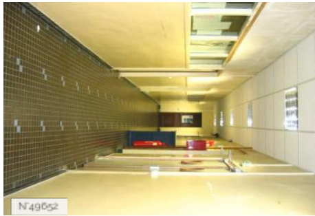
Lycée Octave Feuillet - Couloir