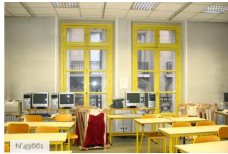
Lycée Octave Feuillet - Salle informatique