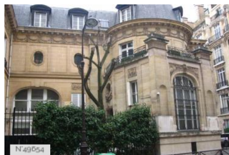
Lycée Octave Feuillet - Façade