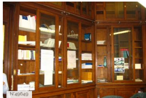
Lycée Octave Feuillet - bureau