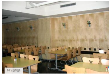
Lycée Octave Feuillet - cantine