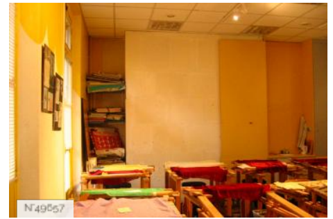
Lycée Octave Feuillet - Salle de broderie