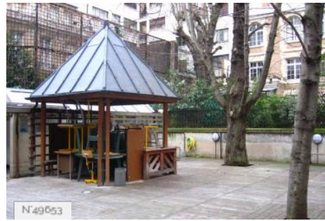
Lycée Octave Feuillet - Cour de récréation