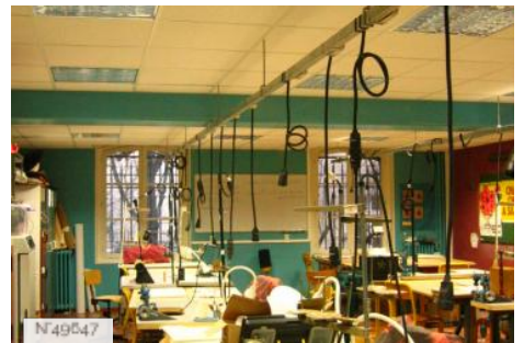
Lycée Octave Feuillet - Atelier de chapellerie