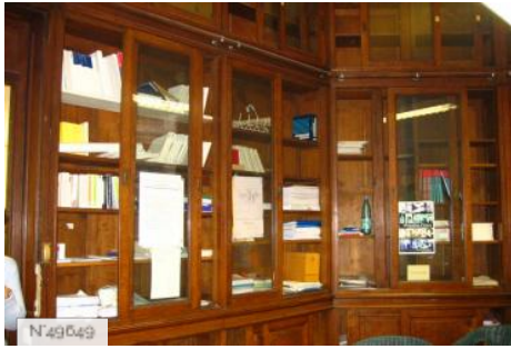
Lycée Octave Feuillet - bureau