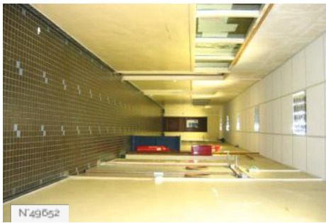
Lycée Octave Feuillet - Couloir