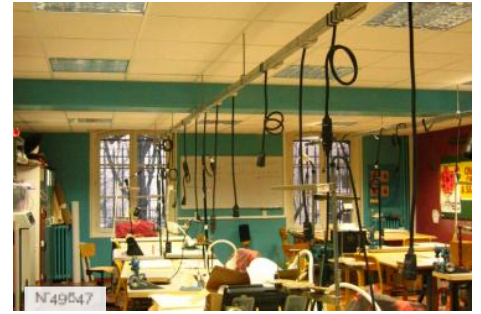
Lycée Octave Feuillet - Atelier de chapellerie