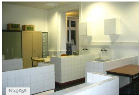
Lycée Octave Feuillet - Salle de laboratoire