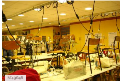
Lycée Octave Feuillet - Atelier de couture