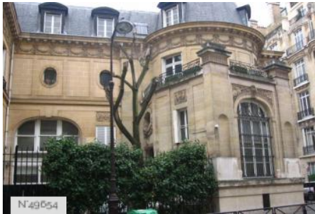
Lycée Octave Feuillet - Façade