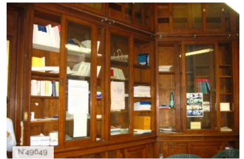
Lycée Octave Feuillet - bureau