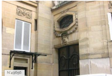
Lycée Octave Feuillet - Petite cour