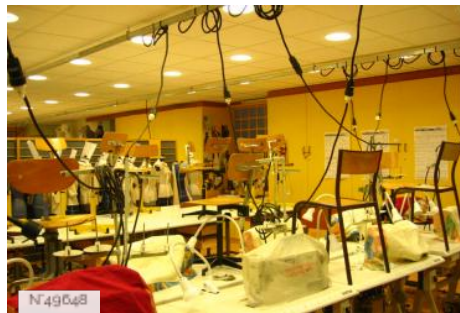
Lycée Octave Feuillet - Atelier de couture