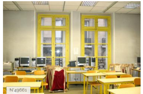
Lycée Octave Feuillet - Salle informatique