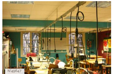
Lycée Octave Feuillet - Atelier de chapellerie