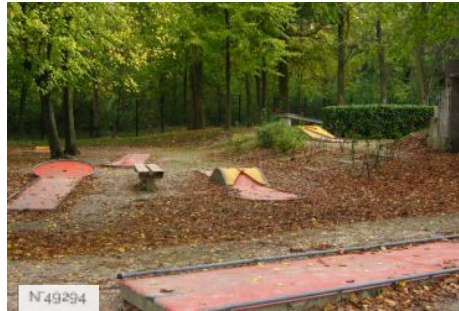
Port-aux-Cerises - minigolf