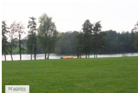
Port-aux-Cerises - étangs