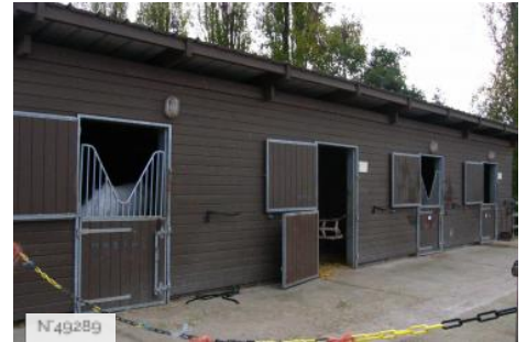
Port-aux-Cerises - Centre équestre