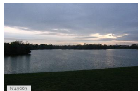
Port-aux-Cerises - plage