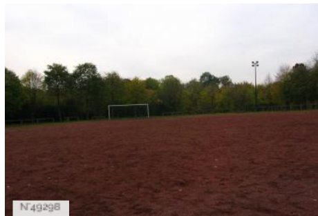
Port-aux-Cerises - Terrain de football