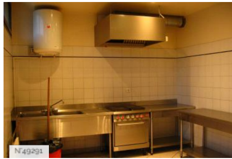
Port-aux-Cerises - cuisine