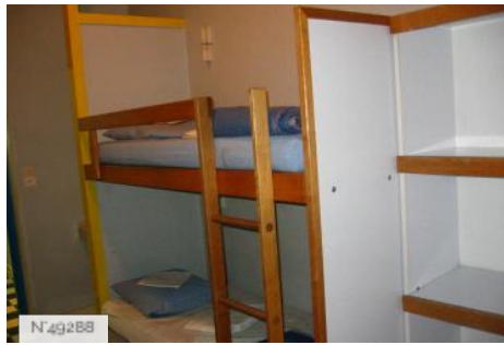
Port-aux-Cerises - auberge de jeunesse