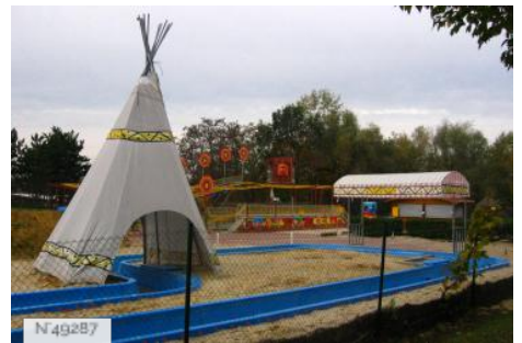
Port-aux-Cerises - aire de jeux