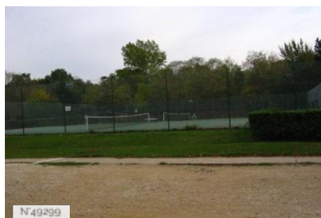
Port-aux-Cerises - Terrain de tennis