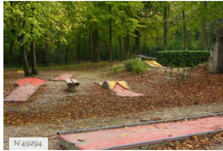
Port-aux-Cerises - minigolf