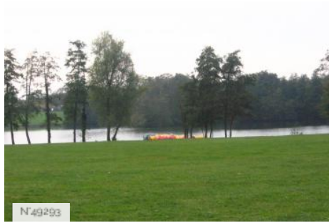
Port-aux-Cerises - étangs