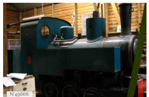
Port-aux-Cerises - Train