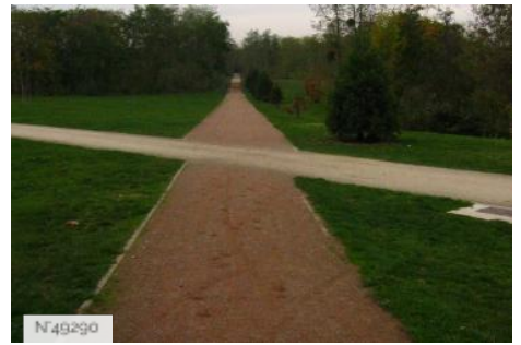
Port-aux-Cerises - Chemin