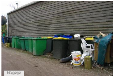
Port-aux-Cerises - dépotoir