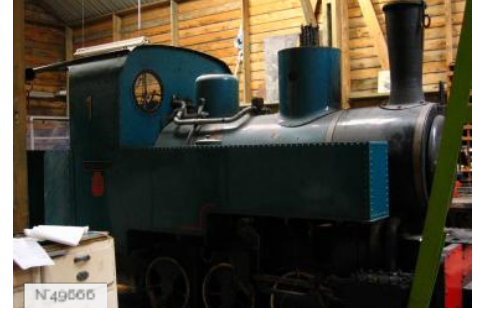
Port-aux-Cerises - Train