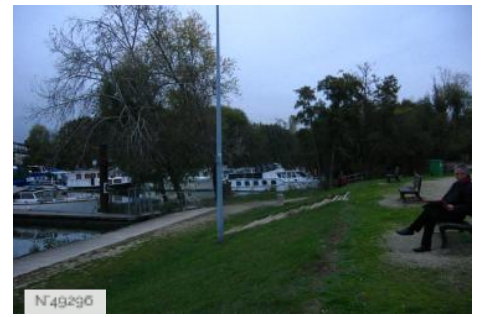
Port-aux-Cerises - Port de plaisance