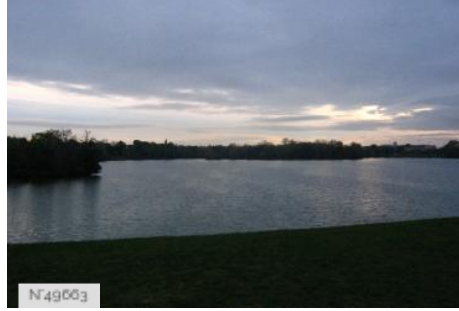
Port-aux-Cerises - plage