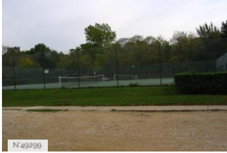
Port-aux-Cerises - Terrain de tennis