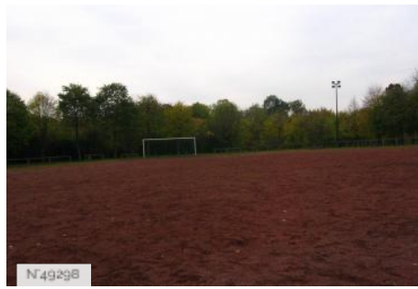
Port-aux-Cerises - Terrain de football