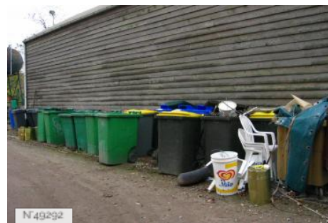
Port-aux-Cerises - dépotoir