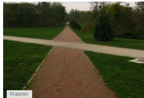
Port-aux-Cerises - Chemin