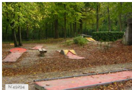
Port-aux-Cerises - minigolf