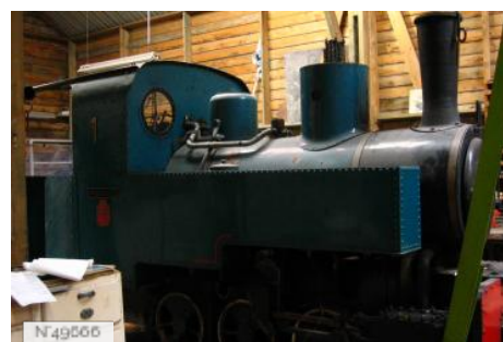
Port-aux-Cerises - Train