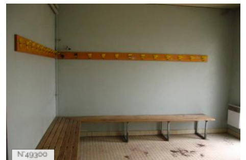
Port-aux-Cerises - vestiaires