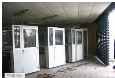
Port-aux-Cerises - piscine