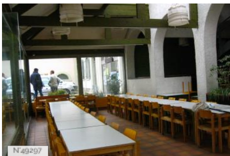
Port-aux-Cerises - Salle