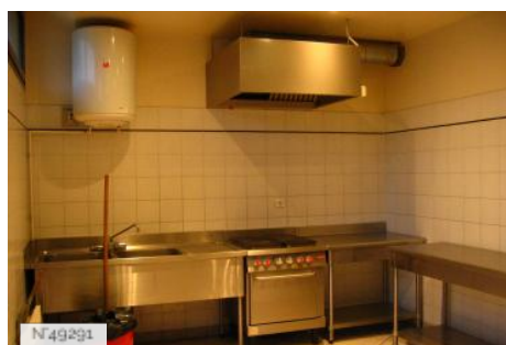
Port-aux-Cerises - cuisine