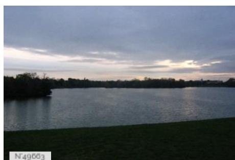
Port-aux-Cerises - plage