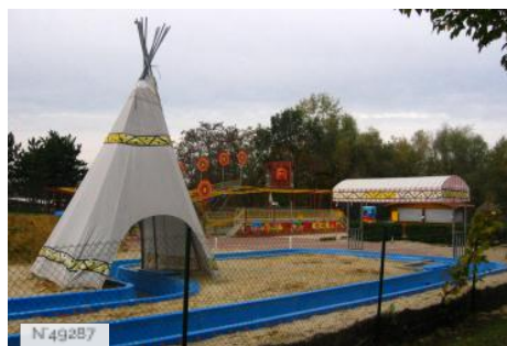
Port-aux-Cerises - aire de jeux