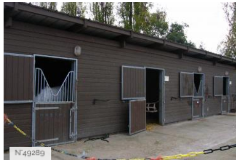
Port-aux-Cerises - Centre équestre