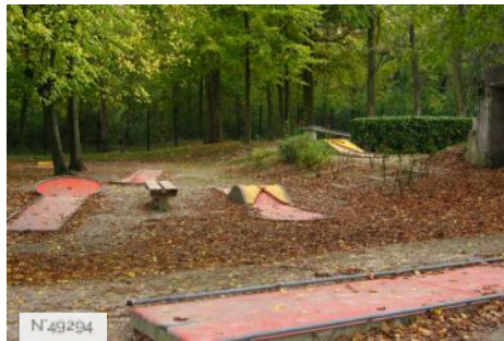
Port-aux-Cerises - minigolf