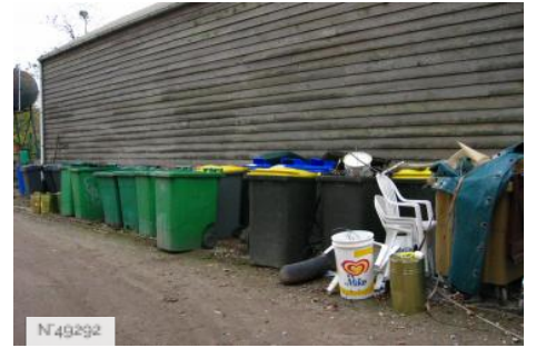
Port-aux-Cerises - dépotoir