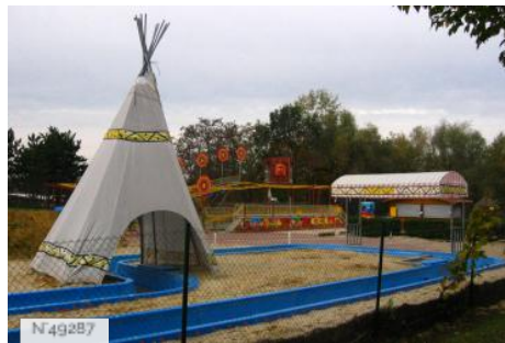
Port-aux-Cerises - aire de jeux