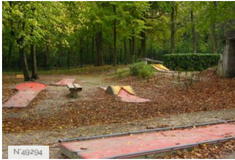
Port-aux-Cerises - minigolf