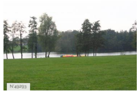
Port-aux-Cerises - étangs