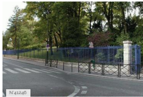
Ville de Paris - Parc Montsouris