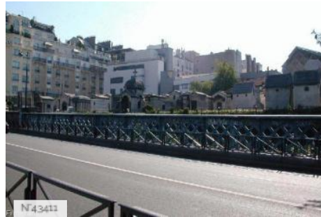
Ville de Paris - Cimetière de Montmartre