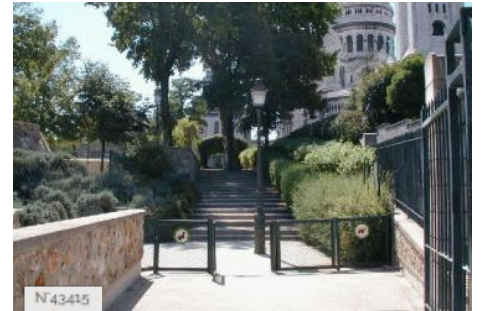
Ville de Paris - Parc de la Turlure