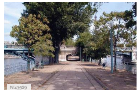
Ville de Paris - Allée des Cygnes-Statue de la Liberté