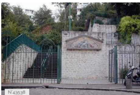
Ville de Paris - Parc de Belleville