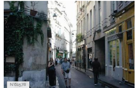
Ville de Paris - Rue des Rosiers