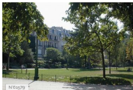
Ville de Paris - Parc Monceau