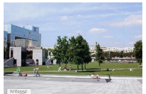
Piscine de la Butte aux Cailles