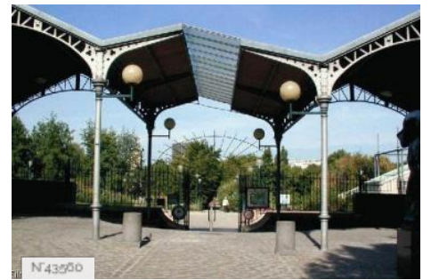
Ville de Paris - Parc Georges Brassens