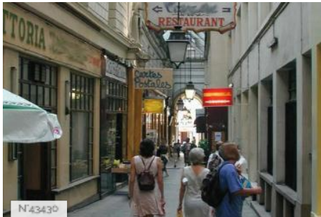
Passage des Panoramas