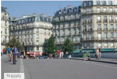
Ville de Paris - Ile Saint Louis