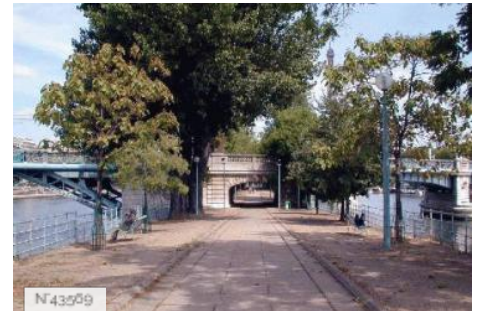
Ville de Paris - Allée des Cygnes-Statue de la Liberté