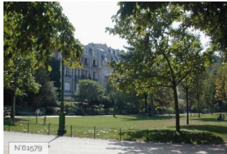
Ville de Paris - Parc Monceau