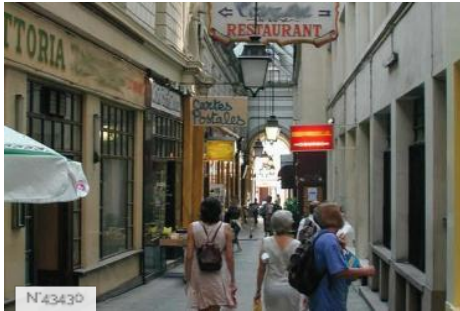
Passage des Panoramas