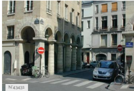
Ville de Paris - Rue des Colonnes