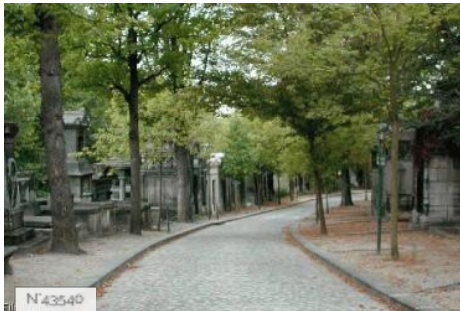
Ville de Paris - Cimetière du Père Lachaise