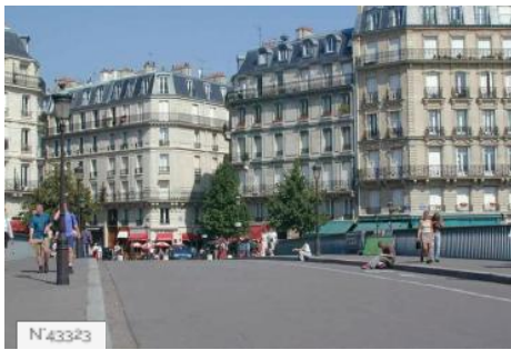
Ville de Paris - Ile Saint Louis