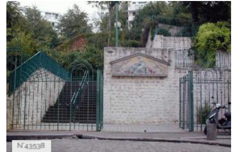
Ville de Paris - Parc de Belleville