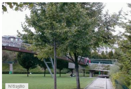
Jardin de Reuilly