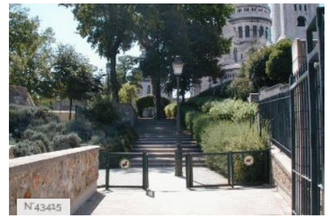
Ville de Paris - Parc de la Turlure