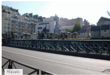
Ville de Paris - Cimetière de Montmartre