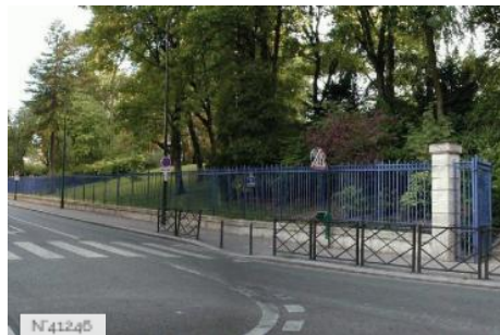
Ville de Paris - Parc Montsouris