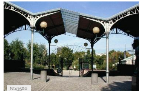
Ville de Paris - Parc Georges Brassens