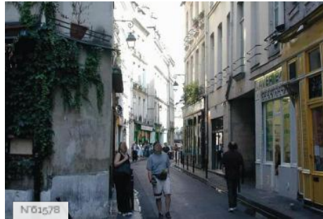
Ville de Paris - Rue des Rosiers