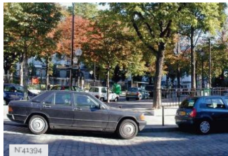
Piscine de la Butte aux Cailles