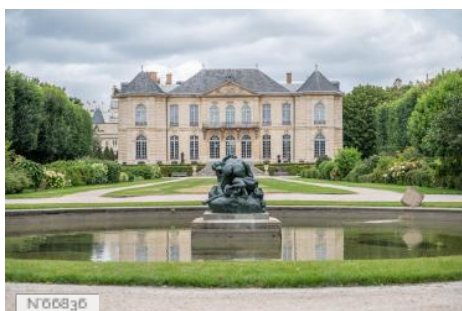
Musée Rodin - Parc et bassin