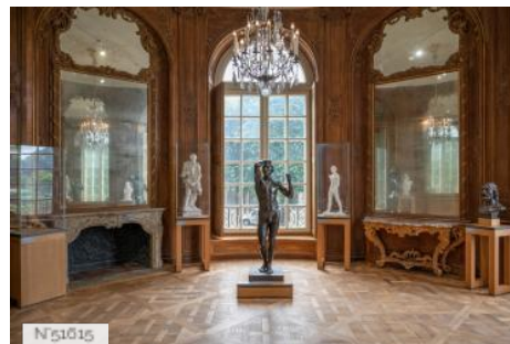
Musée Rodin - Salles d'exposition