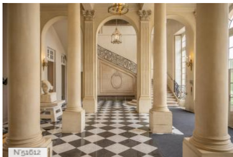
Musée Rodin - Hall de l'hôtel Biron