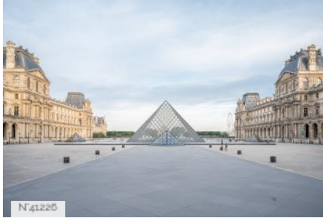
Domaine National du Louvre et des Tuileries - Musée du Louvre