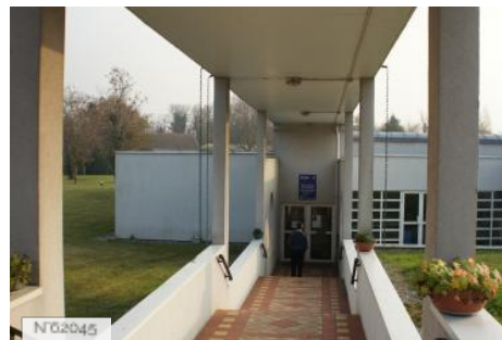
Fort d'Ivry - Médiathèque