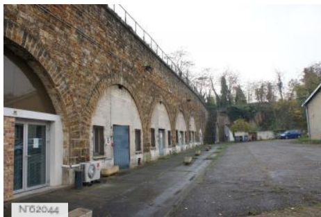
Fort d'Ivry - Pôle des Archives