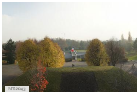
Fort d'Ivry - Extérieurs