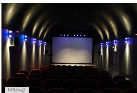
Fort d'Ivry - Salle Abel Gance