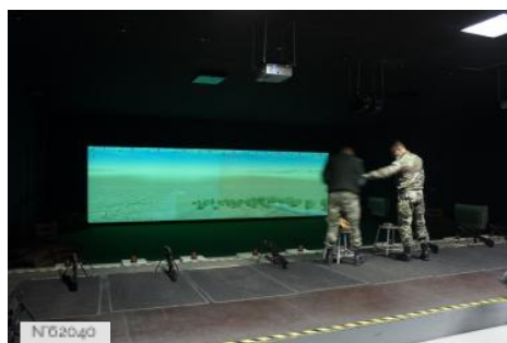
Fort neuf de Vincennes - SITAL