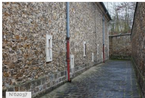
Fort neuf de Vincennes - Poudrière