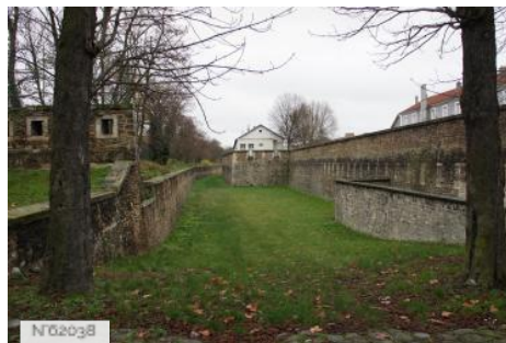
Fort neuf de Vincennes - Douves