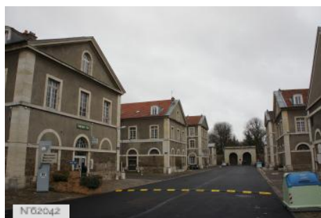
Fort neuf de Vincennes - Extérieurs