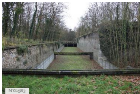
Fort neuf de Vincennes - Ancien champ de tir