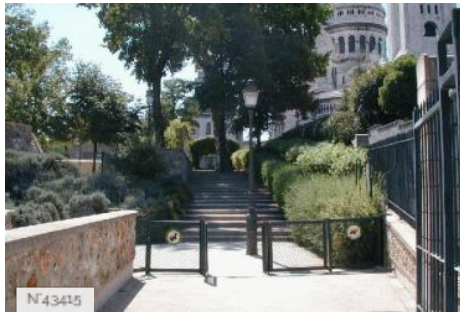
Ville de Paris - Parc de la Turlure