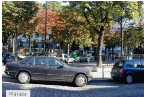
Piscine de la Butte aux Cailles