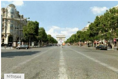
Ville de Paris - Avenue des Champs-Élysées