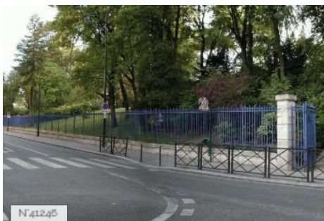
Ville de Paris - Parc Montsouris