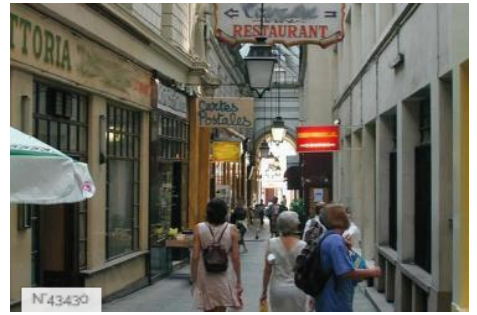
Passage des Panoramas