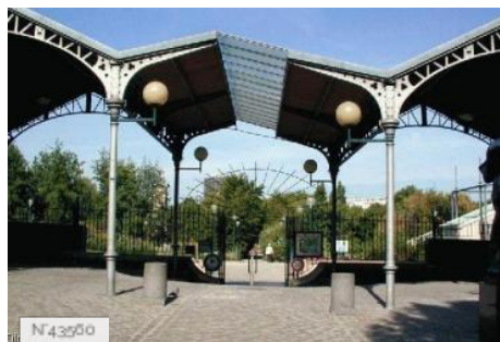
Ville de Paris - Parc Georges Brassens