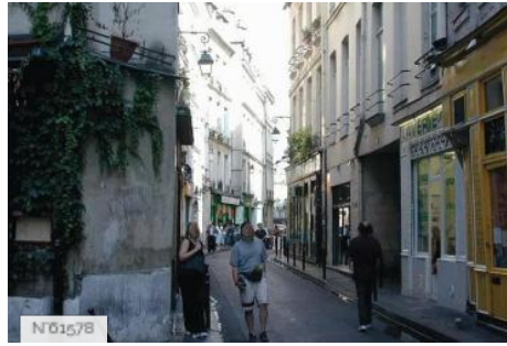
Ville de Paris - Rue des Rosiers