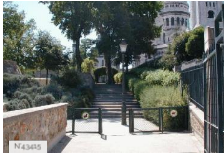
Ville de Paris - Parc de la Turlure