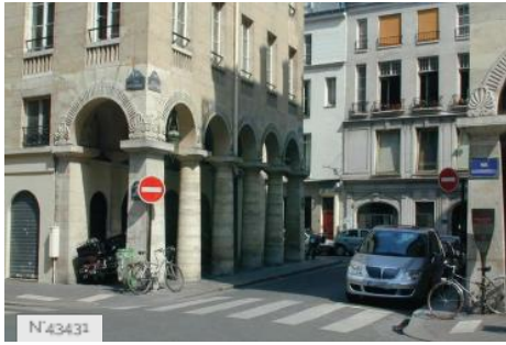
Ville de Paris - Rue des Colonnes