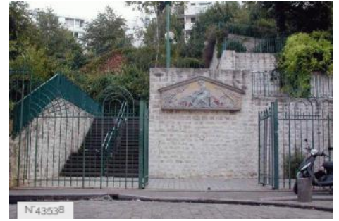
Ville de Paris - Parc de Belleville