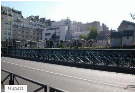
Ville de Paris - Cimetière de Montmartre