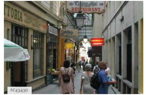
Passage des Panoramas