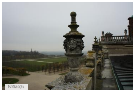
Château et Domaine de Saint-Germain-en-Laye - Toits