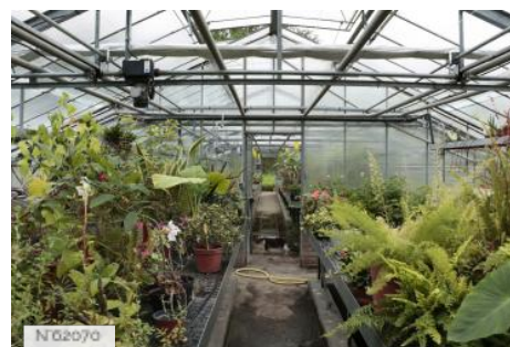
Château et Domaine de Saint-Germain-en-Laye - Serres