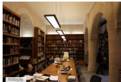
Château et Domaine de Saint-Germain-en-Laye - Bibliothèque