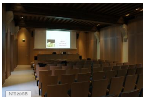
Château et Domaine de Saint-Germain-en-Laye - Espace conférences