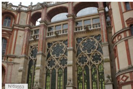
Château et Domaine de Saint-Germain-en-Laye - Chapelle