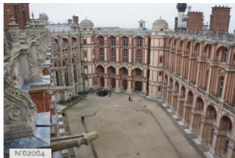
Château et Domaine de Saint-Germain-en-Laye - Cour intérieure