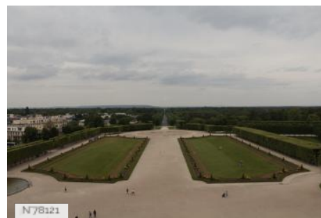
Château et Domaine de Saint-Germain-en-Laye - Parc