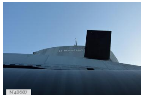
La Cité de la Mer - Ancienne Gare Maritime Transatlantique - Sous-Marin Le Redoutable