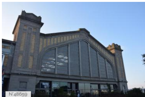
La Cité de la Mer - Ancienne Gare Maritime Transatlantique