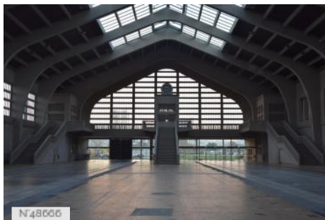
La Cité de la Mer - Ancienne Gare Maritime Transatlantique - Grande Halle