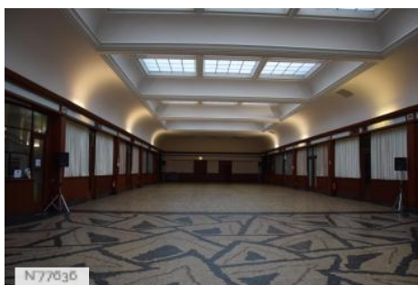
La Cité de la Mer - Ancienne Gare Maritime Transatlantique - Salle des Pas Perdus