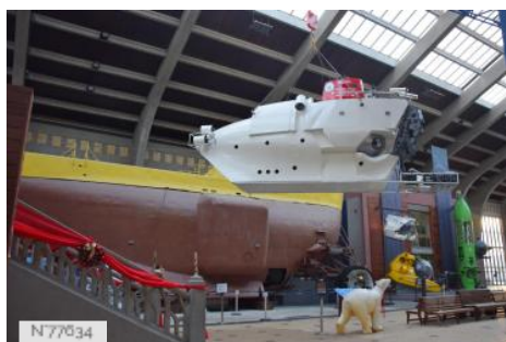
La Cité de la Mer - Ancienne Gare Maritime Transatlantique - Nef d'accueil