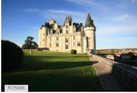
Château de La Rochefoucauld