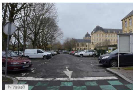
Abbaye aux Hommes - Hôtel de ville de Caen - Parkings alentours