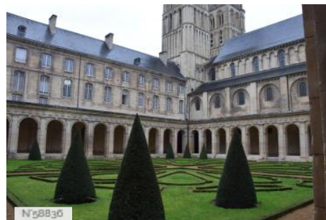
Abbaye aux Hommes - Hôtel de ville de Caen - Cloître