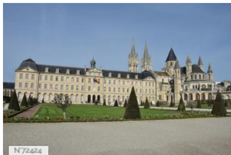
Abbaye aux Hommes - Hôtel de ville de Caen