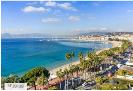
Ville de Cannes