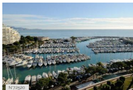
Port de Villeneuve-Loubet