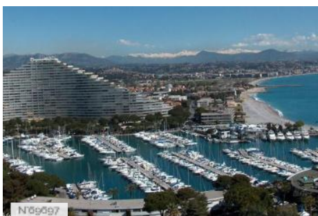
Marina Baie des Anges