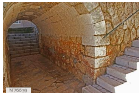
Passage Crémaillère Beausoleil