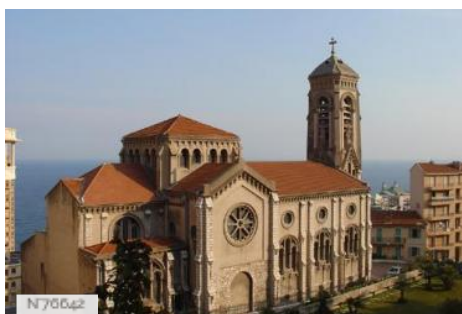
Eglise de Beausoleil