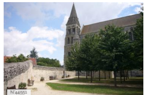
Abbatiale St Nicolas