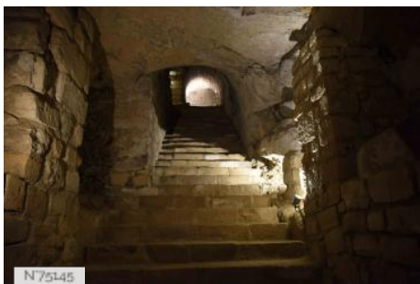
Souterrains du prieuré