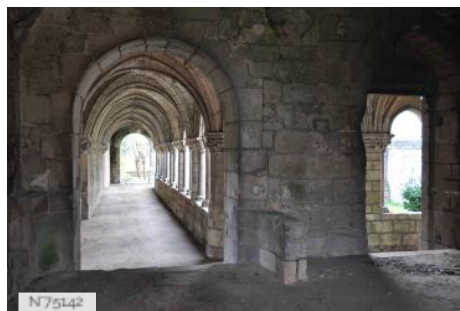
Ancien prieuré d'abbaye