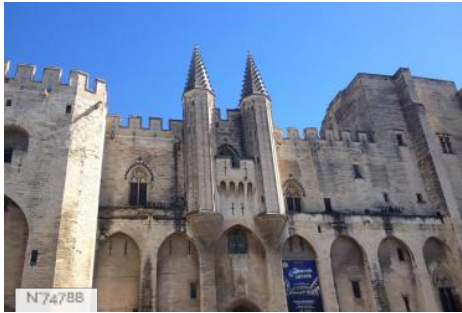
Palais des Papes