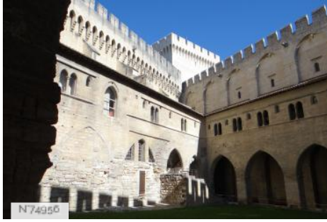
Archives du Palais des Papes (ext.)