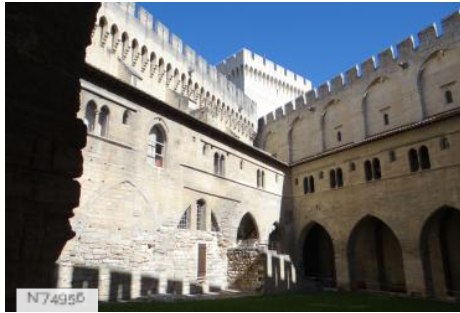
Archives du Palais des Papes (ext.)