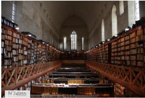
Archives du Palais des Papes (int.)