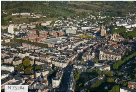
Communauté d'Agglomération Lisieux Normandie