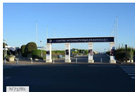
Centre International de Deauville - Extérieur