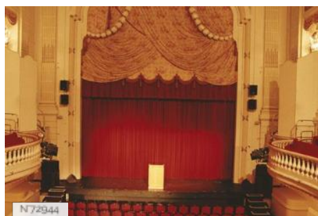
Théâtre Le Petit Trianon