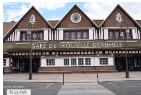
Gare SNCF de Trouville-Deauville